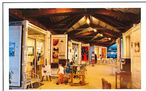
フルサット雁木下の様子